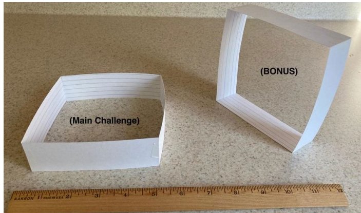
Ejemplos de Diseño del Relleno 1