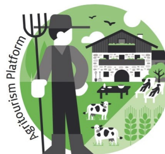
International Workshop on Agritourism

El Taller internacional sobre agroturismo llegará a Burlington, Vermont, del 30 de agosto al 1 de septiembre de 2022 . Únase a los profesionales de la industria de la agricultura y el turismo de los Estados Unidos y más allá en un emocionante programa lleno de sesiones educativas, presentaciones de carteles, talleres prácticos, recorridos por granjas y eventos para establecer contactos. ¡Agricultores, proveedores de servicios agrícolas, expertos en turismo y aquellos interesados en aprender más sobre agroturismo están invitados a asistir y compartir sus propios conocimientos, experiencias y conocimientos!