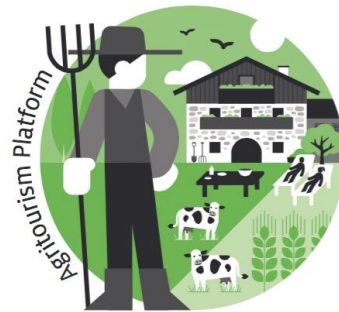
International Workshop on Agritourism

El Taller internacional sobre agroturismo llegará a Burlington, Vermont, del 30 de agosto al 1 de septiembre de 2022 . Únase a los profesionales de la industria de la agricultura y el turismo de los Estados Unidos y más allá en un emocionante programa lleno de sesiones educativas, presentaciones de carteles, talleres prácticos, recorridos por granjas y eventos para establecer contactos. ¡Agricultores, proveedores de servicios agrícolas, expertos en turismo y aquellos interesados en aprender más sobre agroturismo están invitados a asistir y compartir sus propios conocimientos, experiencias y conocimientos!