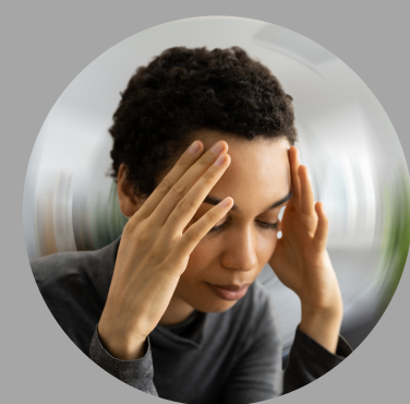
呼吸困难和头晕等过敏性反应