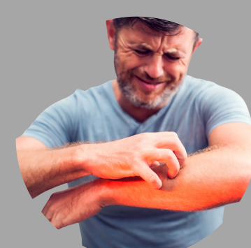
Reakcje skórne, takie jak wysypka, obrzęk lub swędzenie