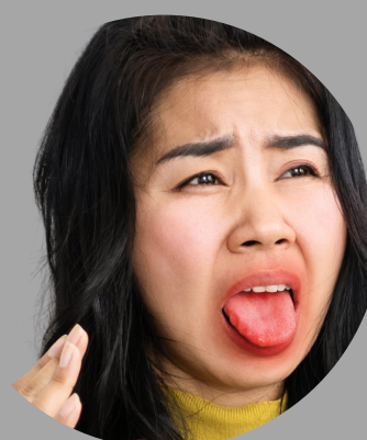
Uczucie pieczenia w obrębie warg i jamy ustnej